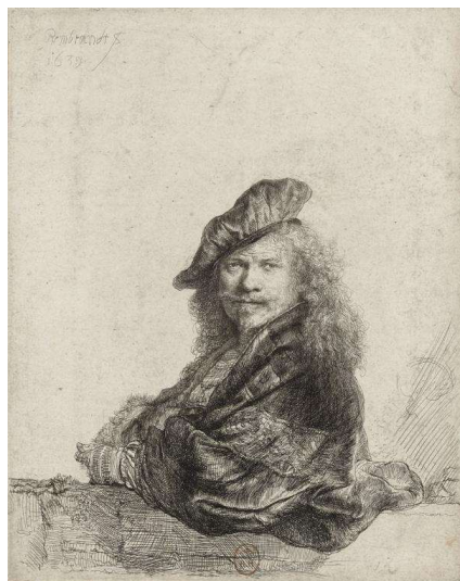
3 pav. Rembrandt van Rijn. „Atsirėmusio į akmeninę palangę autoportretas“ (1639)

Pateikiant meno kūrinio iliustraciją, po paveikslo numeracijos būtina nurodyti meno kūrinio metriką: kūrinio autorius, kūrinio pavadinimas, kūrinio sukūrimo metai. Žr. 3 pav.: